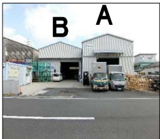
倉庫内で接車し、天候問わず快適な荷崩しが可能！