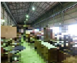
シャッター寸法(H約4500×W約4800)